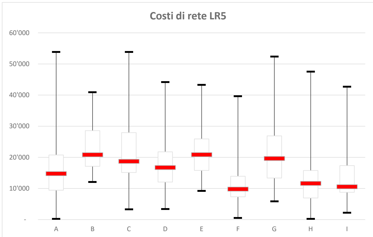
Box-plot costi di rete del livello di rete (LR) 5 (due valori sono stati esclusi dalla rappresentazione grafica)