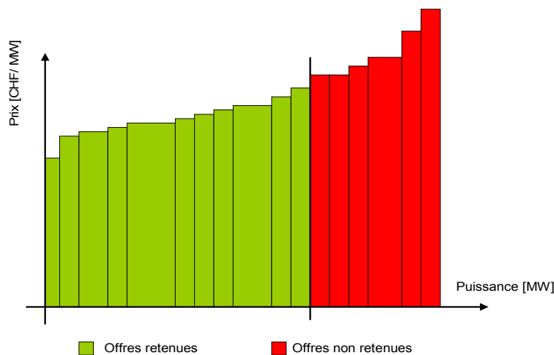
Figure 3: Attribution des capacités de réglage (exemple théorique)

Etant donné les coûts élevés pour la réservation de capacités de réglage pour les premiers mois de l'année 2009, swissgrid a modifié les conditions d'appel d'offres pour le 1 er juillet 2009 (source [6], pages 4 et 5). Un prix plafond (price cap) est fixé pour chaque fourniture de puissance de réglage. Les offres supérieures au prix plafond ne seront pas prises en compte. Par ailleurs, le principe du „pay as bid“ s'applique également à la rémunération de la réservation de capacités de réglage primaire et secondaire. Les coûts pour la réservation de puissance de réglage devraient s'en trouver substantiellement réduits.